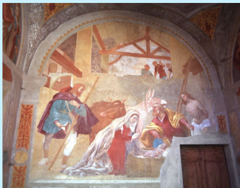
La chiesa di San Giorgio: gli affreschi di Lorenzo Lotto (Credaro)

La chiesa romanica di san Giorgio, antica parrocchiale dalle evidenti origini romaniche, presenta una pianta ad aula unica di forma rettangolare orientata ad est, terminante con un'abside semicircolare e coperta da un tetto a doppia falda; esternamente lungo la parete nord è collocato il monumento funebre di Bertolinus Peramatus (1303), caratterizzato da un'insolita decorazione a fasce bicrome in pietra calcarea di colore verde di Zandobbio e pietra arenaria di Sarnico.